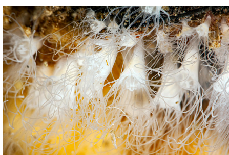
Polypes de méduses aurélias