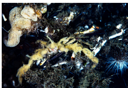
Araignée des anémones