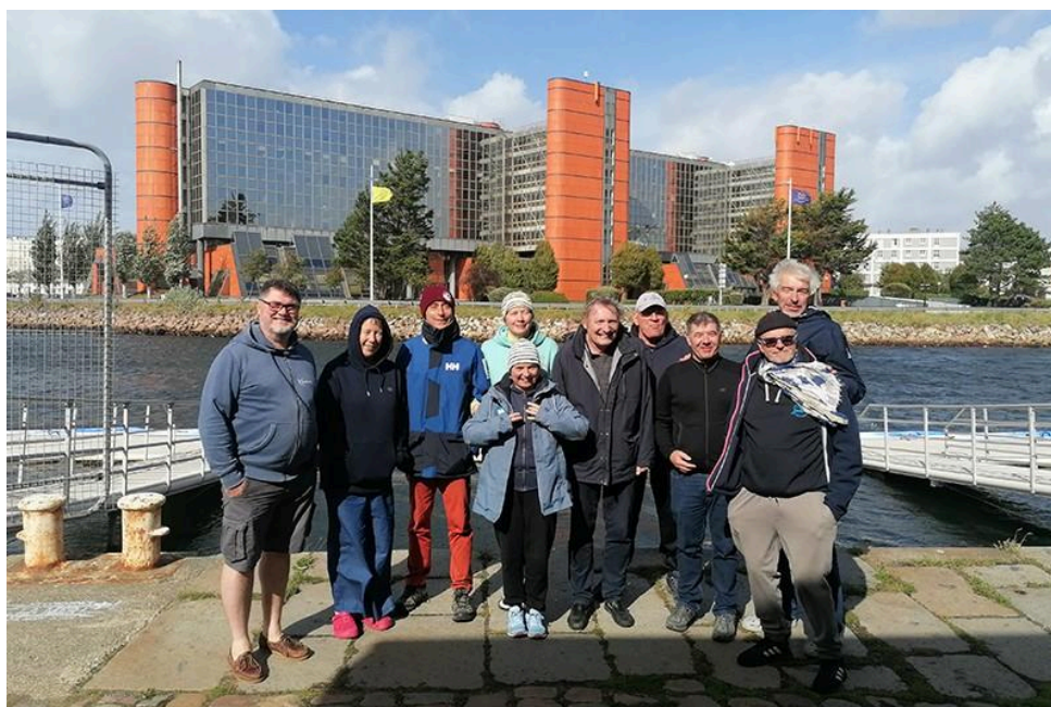
Les heureux photographes dans le vent !