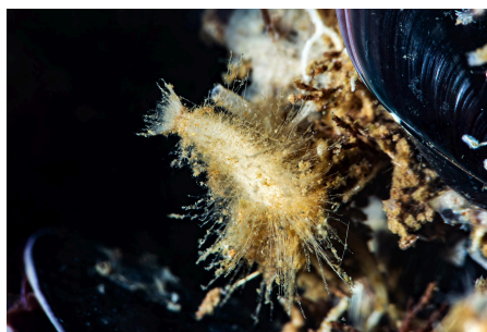
Eponge petit oeuf